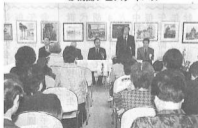
’04年12月11日 移情閣と舞子風景を描く・展覧会 表彰式