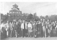
’89年10月15日 秋のバス旅行 湖北の秋