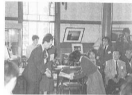
’88年 移情閣展 表彰式