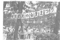
’95年8月27日 移情閣まつり パレンダインの里 作東町と交流