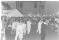
’87年8月9日 納涼まつり