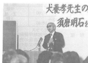
’85年11月25日犬養孝先生 万葉講座 須磨・明石万葉のタベ