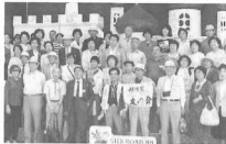
’88年5月29日春のバス旅行奈良シルクロード博