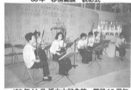
’93年11月 孫中山記念館 開設10周年 移情閣フェスティバル